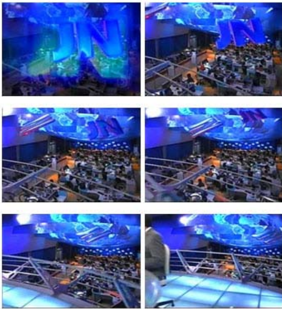
Figura 2 - Finalização da vinheta e início da entrada no estúdio.

Focaliza-se primeiramente o apresentador, demonstrando um trato gentil, e, a seguir, o segundo apresentador. A câmera pousa suavemente, ao enquadrar a mesa arredondada, como se flutuasse sobre o piso simétrico, e, finalmente aparecem juntos os dois apresentadores ladeados por dois logos do JN e o globo terrestre; este, agora, bem definido e posicionado no fundo e ao centro. Inicia-se o programa, como mostra a Figura 3.