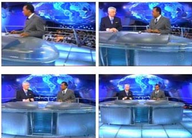
Figura 3 - Já no estúdio, takes antes do início do programa.

Focaliza-se primeiramente o apresentador, demonstrando um trato gentil, e, a seguir, o segundo apresentador. A câmera pousa suavemente, ao enquadrar a mesa arredondada, como se flutuasse sobre o piso simétrico, e, finalmente aparecem juntos os dois apresentadores ladeados por dois logos do JN e o globo terrestre; este, agora, bem definido e posicionado no fundo e ao centro. Inicia-se o programa, como mostra a Figura 3.